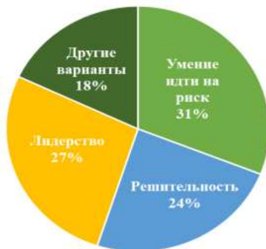
Рисунок 1. Диаграмма распределения ответов прохожих

Рассматривая все эти качества в совокупности (рис. 1), можно сказать о том, что люди, далекие от бизнеса, в основном говорят о тех качествах, которыми сами не наделены и, в следствии чего, боятся, что у них ничего не получится.