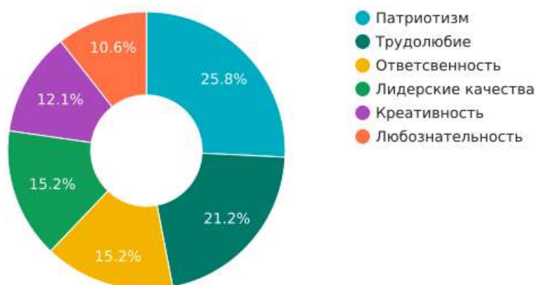
Рисунок 2. Результаты опроса учителей

Мы попросили учителей поделиться информацией, о том, какие качества, на их взгляд, объединение смогло воспитать в учащихся. Были получены следующие ответы: самое часто упоминаемое качество – это патриотизм (25,8%), после патриотизма с разницей в три голоса следует трудолюбие (21,2%). Третье место поделили сразу два качества – ответственность и лидерские качества (15,2%). В самом конце опроса находятся креативность (12,1%) и любознательность (10,6%) (рисунок 2).