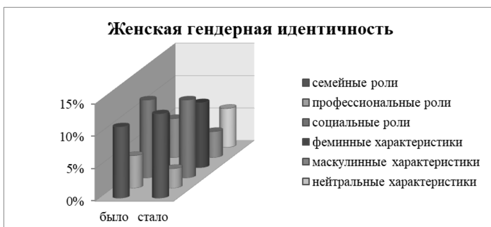
Рисунок 2 - Сопоставительные результаты опросника «Кто я?» по диагностике женской гендерной идентичности личности (констатирующий и контрольный эксперименты)

На этапе констатирующего исследования мы выявили, что не все обучающиеся знают гендерные стереотипы и социальные роли, т.е. в недостаточной мере осознают гендерные стереотипные ролевые установки мужчин и женщин (в личностном, социальном, семейном и т.д. плане). Решение данной проблемы мы обозначали как одно из приоритетных при организации опытного обучения, и нам важен был положительный результат, который мы и выявили, сопоставив данные по методике адаптированного нами для младших школьников опросника «Я женщина, я мужчина»