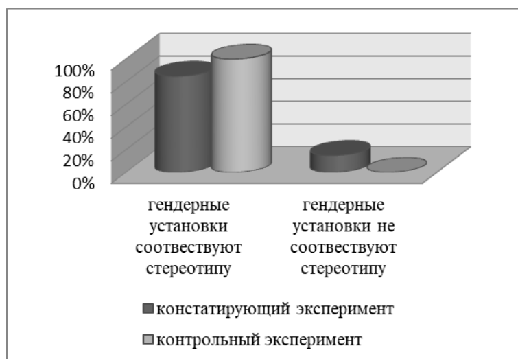
Рисунок 3 - Результаты сопоставительных данных опросника «Я женщина, я мужчина» по осознанию гендерных стереотипов и социальных ролей (констатирующий и контрольный эксперименты)

(автор Л.Н. Ожигова), полученные при его реализации на этапе констатирующего и контрольного экспериментов (рисунок 3).