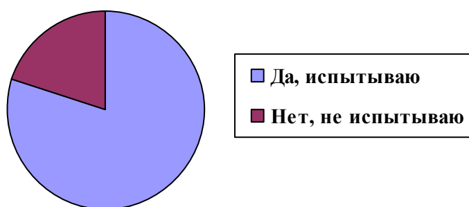
Рисунок 2. Результаты ответов респондентов на пятый вопрос анкеты

Конкретизировали виды трудностей именно эти двенадцать респондентов. Трудности, связанные с дополнительными временными затратами на подготовку работы с заданиями, содержащими исторические сведения (дополнение данных задания либо дополнительными вопросами по выбранной исторической тематике либо кратким комментарием предлагаемых в заданиях исторических событий), обозначили девять участников анкетирования. На трудности, возникающие при разработке заданий (по математике, русскому языку) с использованием исторического материала, указали семь респондентов. О затруднениях при выборе тем индивидуальных и групповых проектов по истории высказались четверо участников анкетирования. Ни один из двенадцати респондентов не выбрал вариант ответа, предусматривающий возникновение трудностей с использованием наглядного материала по истории.