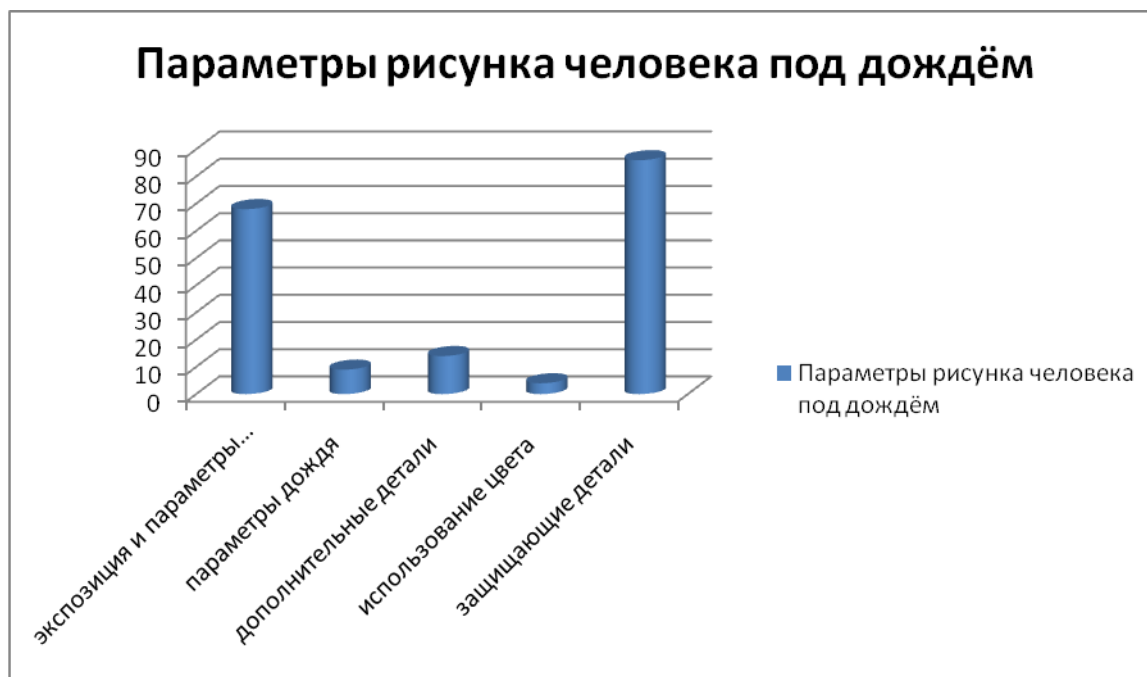
Рисунок 2 – Изменение параметров фигуры человека в рисунках детей старшего дошкольного возраста по методике «Человек под дождем» (%)

Полученные данные об особенностях психологической защиты по методике «Человек под дождем» представлены на рис. 2.